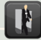
ARCOS DE CONTROL