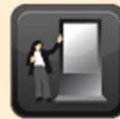
AULA VIRTUAL DE POSTERS